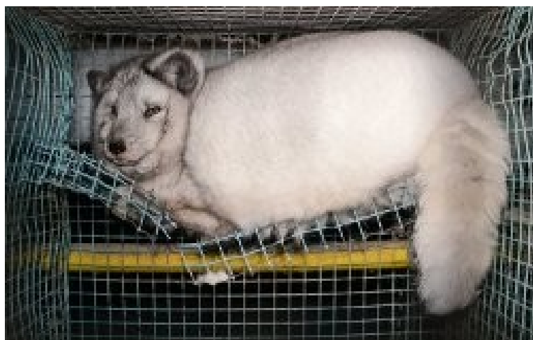
La Griffe sera place de Jaude, le 14 janvier, pour marquer la Journée sans fourrure.

Le samedi 14 janvier, à partir de 15 heures, quelques-uns d’entre nous seront place de Jaude pour une action anti-fourrure et anti-gavage , organisée avec le soutien logistique des associations Fourrure Torture et L214 .